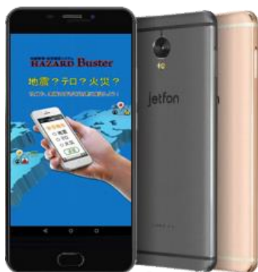
jetfon と HAZARD Buster イメージ